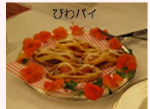
昨年の市長賞の作品 (創作菓子の部)